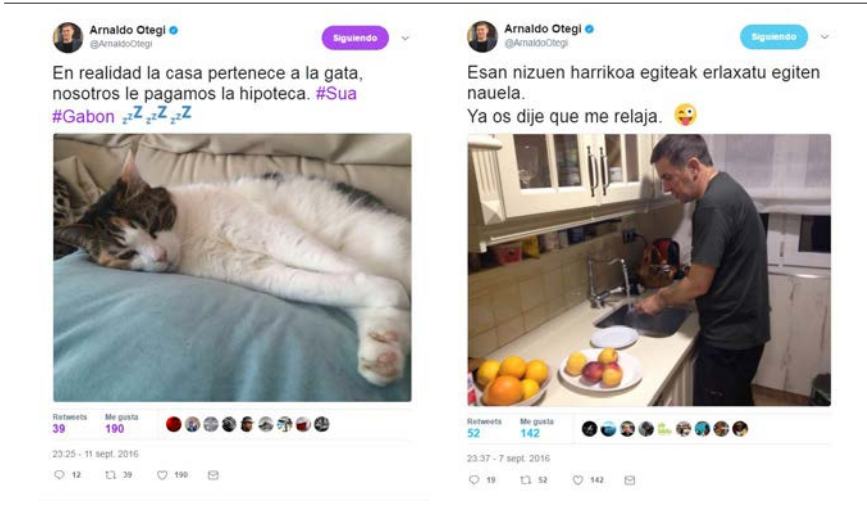
Figura 4. Twitter de Arnaldo Otegi.

En el caso de Arnaldo Otegi, su perfil de Twitter era el que más seguidores tenía entre todos los candidatos a lehendakari, con gran diferencia 8 , y destacaba por ser un espacio que combinaba mensajes políticos del programa de la coalición con la vida privada del protagonista, así como con referencias a la política internacional, a los líderes internacionales, a acontecimientos sociales tratados con humor, etc.