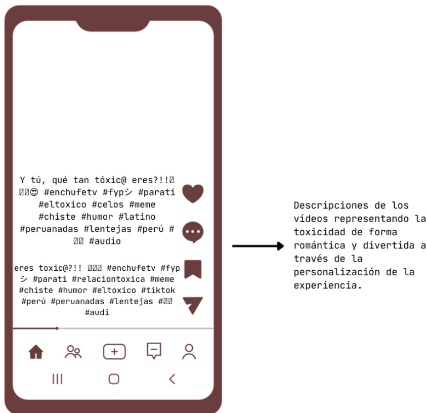
Figura 4. Ejemplo de representación de la violencia

tóxico» o la simulación de contacto de un amante o una llamada insistente al móvil (figura 4).