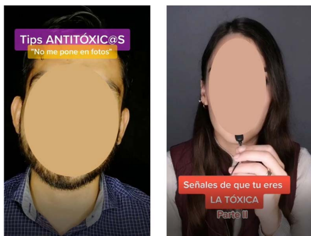
Figura 3. Ejemplos de vídeos de concienciación

Estos videos consisten en difundir actitudes tóxicas para que sean fácilmente identificables y poder tomar conciencias sobre ellas. Tienen un enfoque educativo y psicológico.