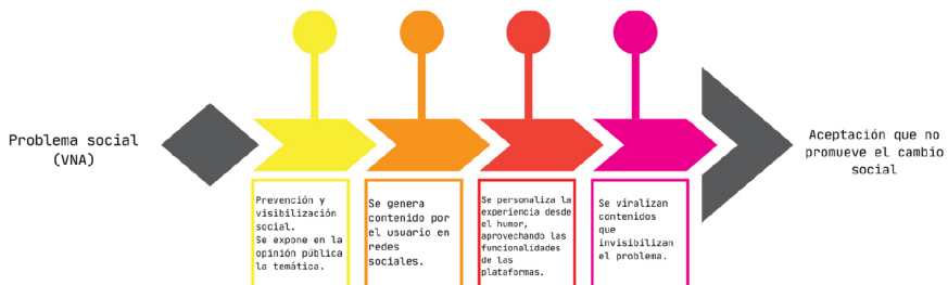
Figura 2. Ciclo de normalización de la VNA

Sin embargo, esto puede tener un efecto negativo, ya que, en un intento de crear conciencia sobre la anomalía de los comportamientos tóxicos, muchas personas pueden narrarlo en TikTok como una realidad común, conectar con más personas y terminar rechazando este problema social. El humor puede ser una herramienta poderosa para conectar con los demás, pero también puede contribuir a trivializar conductas problemáticas. Este estudio refleja que el contenido de estos discursos no se enfoca en la prevención y educación, sino en la colectivización de una idea equívoca: los comportamientos abusivos son motivo de humor. Este fenómeno ocurre cuando se caricaturizan problemas sociales (Matamoros-Fernández, 2023) y de acuerdo con nuestro análisis, en el caso de la VNA, sigue el siguiente patrón (figura 2).